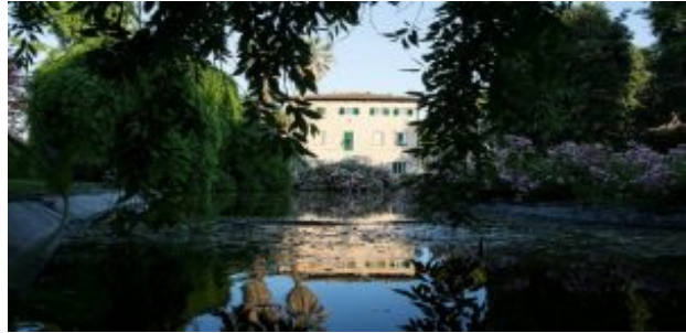
Il borgo storico Seghetti Panichi

Il tema del wedding , più di ogni altro, riesce a rendere in maniera innovativa questo complesso insieme di ricchezze, risorse e professionalità, e al tempo stesso riesce a coniugare gli aspetti che da sempre caratterizzano l'identità del territorio marchigiano, nel suo mix unico di tradizione e innovazione, di legame con la storia e di sguardo alla contemporaneità.