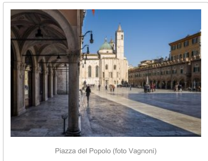
Piazza del Popolo

Il team messo in campo per la realizzazione della serie web comprende operatori specializzati che si occuperanno in toto della realizzazione del prodotto cinematografico , dal soggetto e sceneggiatura al casting e alla selezione delle location , dalle riprese al montaggio, produzione, post-produzione, distribuzione e promozione.