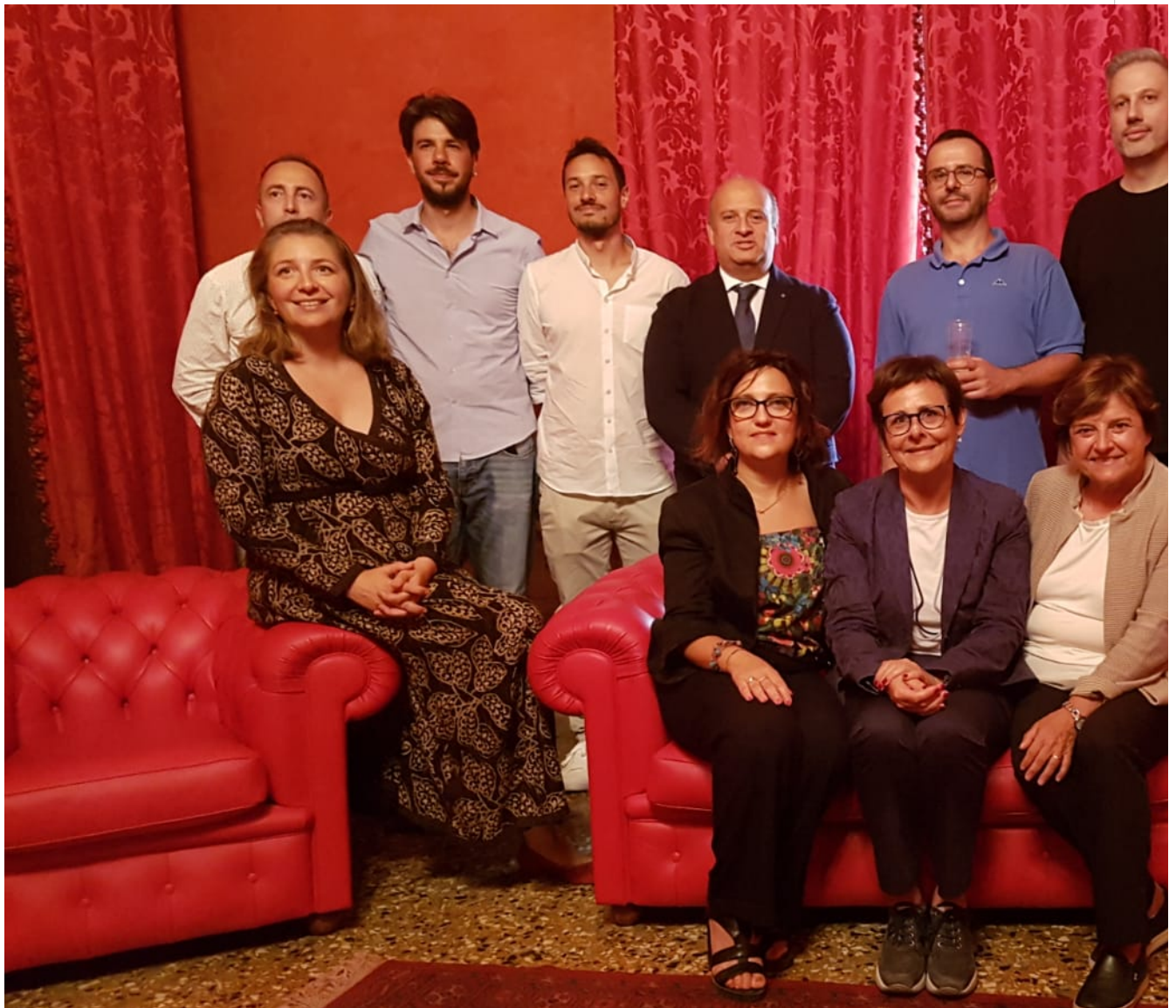
Il cast tecnico con le autorità presenti alla conferenza stampa

E' stata presentata ufficialmente questa mattina (venerdì) alla Sala Gialla della Camera di Commercio laserie web "Non voglio mica la luna", ultima nata in casa Art For Job, un progetto sostenuto dalla Regione Marche – Fondo Europeo di Sviluppo regionale, Fondazione Marche Cultura – Marche Film Commission, e patrocinato dal Comune di Offida.